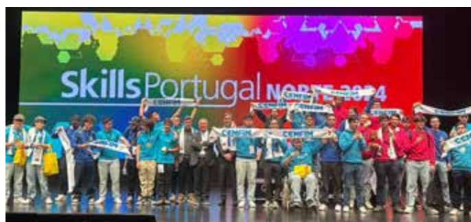
OS MEDALHADOS DE PÓDIO, COM O PRESIDENTE E VOGAL DO CONSELHO DE ADMINISTRAÇÃO DO CENFIM E O DIRETOR DO CENFIM

O CENFIM conquistou no 46.º Campeonato Nacional de Profissões 29 medalhas das quais 11 de Ouro, 9 de Prata e 9 de Bronze. Faltando, contudo, a confirmação oficial das medalhas de excelência.