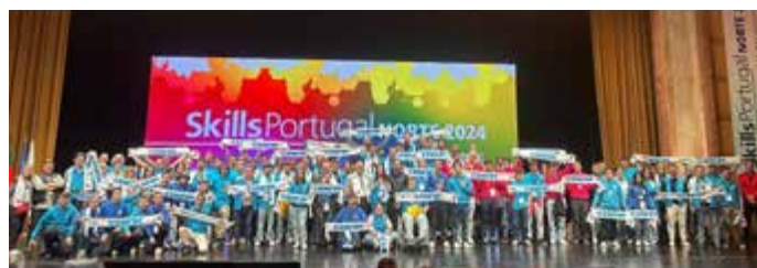
A EQUIPA DO CENFIM

A equipa do CENFIM, obteve um grande resultado no 46.º Campeonato Nacional das Profissões, Europarque 2024, e mais uma vez deixou a sua marca!